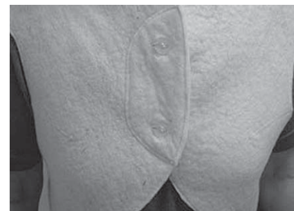
Kipupotilaan selkä-hartiaseudun lämmitin