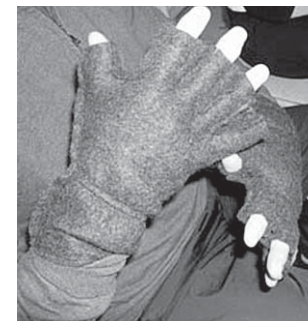
Kipupotilaan hoitavat lämmittimet